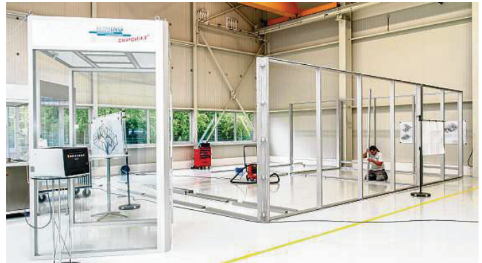
Reinraum Demo: Im Show- und Demonstrationsraum wird den Besuchern beim Tag der offenen Tür das Reinraumsystem Cleancell 4.0 präsentiert. Ein Reinraum, der partikelarme Produktion mit moderner Informationstechnik verbindet und außerdem mit einem geringen Energieverbrauch punktet.