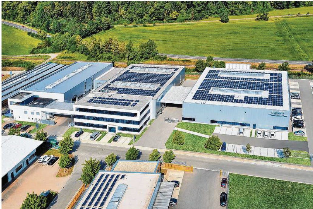
Beim Tag der offenen Tür haben die Besucher die Gelegenheit die Firma Schilling Engineering kennen zu lernen. Rechtzeitig zum 20-jährigen Bestehen, ist die neue Logistikhalle (rechts) fertig gestellt worden.

Aber was ist ein Reinraum eigentlich? Wo wird die Reinraumtechnik gebraucht und wie erschaffen? Diese Fragen beantworten die Profis von Schilling Engineering beim Tag der offenen Tür gerne. Und natürlich gibt es Reinraum auch live zu erleben, denn im neuen Showroom „Cleancell 4.0“ wurden alle Innovationen integriert, um den Besuchern die Technik vor Ort zu demonstrieren. Von der voll ausgestatteten Schleuseneinrichtung über das innovative GMP Dicht-Clip-System zur Verbindung von Wand und Deckenelementen bis hin zum modernen CR-Control-Steuerungs- und Kontrollsystem ist